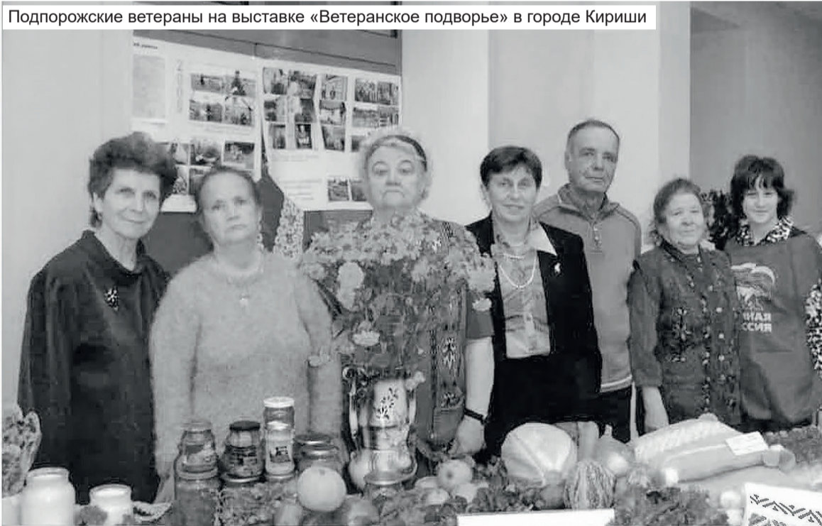
Подпорожские ветераны на выставке «Ветеранское подворье» в городе Кириши