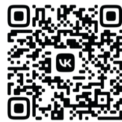
ВидеOVERсия ТК «СвирьИнфо»

Отметим, что тротуар на проспекте Ленина в Подпорожье начали ремонтировать в мае. Его протяжённость – чуть более одного километра. В рамках проекта на проспекте создали места для отдыха и детскую игровую площадку.